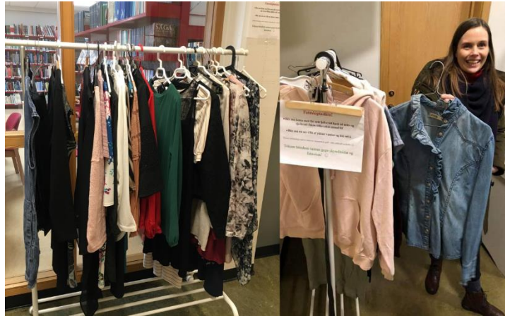
Mynd 3. Forsætisráðherra Íslands, Katrín Jakobsdóttir, skoðar fataskiptaslána.

https://www.austurfrett.is/frettir/vilja-vekja-athygli-a-fatasoun