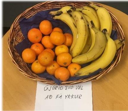
Mynd 2. Mandarínur og bananar í boði.

Markmið 2: Efla lýðheilsu með því að gleðja nemendur í aðdraganda prófatíðar. Mandarínur og bananar voru í boði fyrir nemendur og starfsfólk í aðdraganda prófa og í prófatíð, haust 2018. Markmið að efla lýðheilsu með því að bjóða uppá holla bita og gleðja í leiðinni „magnesíum gott fyrir taugar“ . Umhverfisnefndin sá um að setja mandarínur og banana í skálar í nemendarymi og ganga skólans (mynd 2). Niðurstaða: Það var mat nefndarinnar að þetta hafi tekist mjög vel. Nemendur voru glaðir með uppátækið og mikið var borðað af mandarínunum og bönunum á þessu tímabili í skólanum.