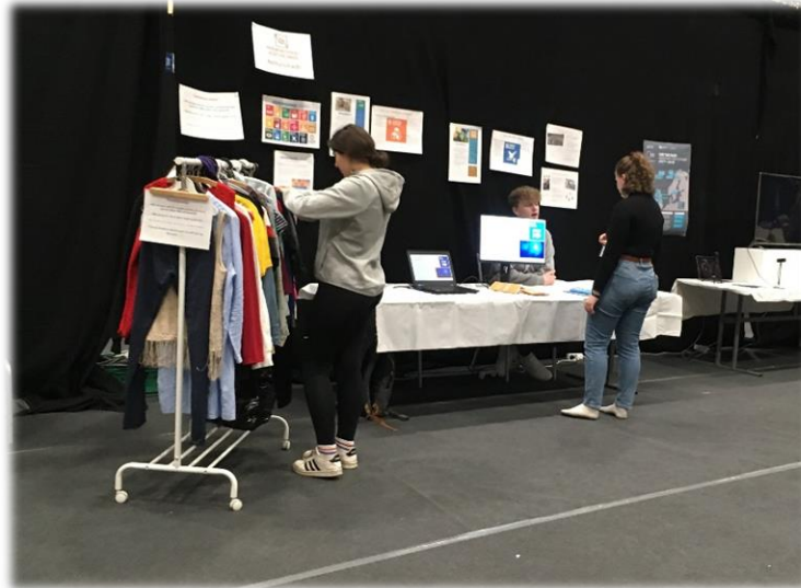
Mynd 4. Frá Tæknidegi fjölskyldunnar, október 2019.

Markmið 6: Athuga með í mótuneytinu að hafa eina fisk og kjötlausu máltíð (grænmetismáltíð) í viku til að vekja athygli á kolefnisspori kjötneyslu og til að heilsueflingar. Bréf sent á forsvaraðila mótuneytis og efnið kynnt.