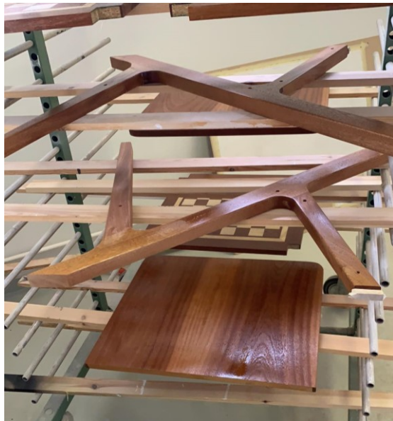
Stóllinn í lökkun