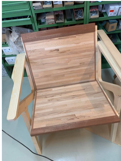
Bakið og setan fyrir spónlagningu