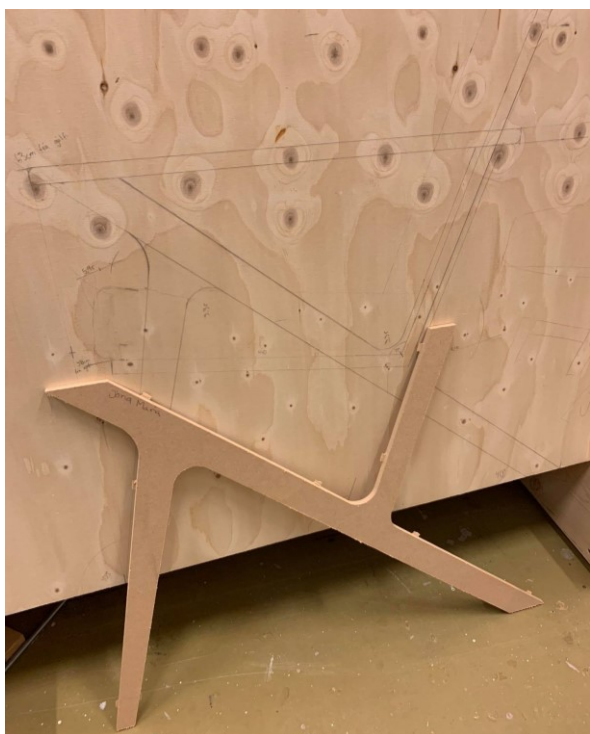
Teikning og máti úr Fablab