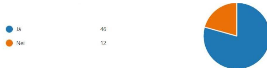
Mynd 3. Vissir þú að foreldraráð er starfandi innan skólans?

Á Mynd 3 má sömuleiðis sjá að stór hluti svarenda veit að foreldraráð er starfandi innan skólans eða 46 svarendur sem gera 79%.