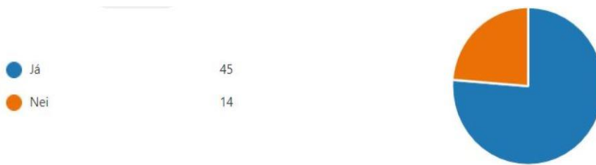
Mynd 2. Hefur þú komið á fundi sem skólinn hefur staðið fyrir s.s. foreldrafundi eða kynningarfundum?

hvers vegna þeir sem höfðu ekki sótt fundi gerðu það. Þær ástæður sem svarendur nefndu voru fjarlægð, tímasetning, COVID og gleymaska.