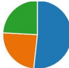
Mynd 8. Hefur þú verið í samskiptum við einhvern af kennurum nemandans?