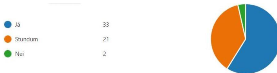
Mynd 11. Segir nemandinn þér frá gengi sínu í námi og starfi í skólanum?

Á Mynd 11 má sjá að meirihluti svarenda, eða 59%, segir að nemandinn segi sér frá gengi í námi og starfi í skólanum en aðeins tæp 4% segja að nemandinn geri það ekki.