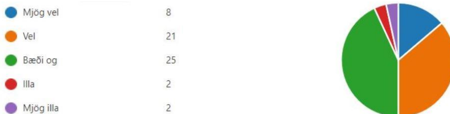
Mynd 6. Hversu upplýst(an) telur þú þig vera um stefnu skólans, aðalnámskrá og skólanámskrá?

Þegar skoðað er hversu upplýstir svarendur eru um lykiltríði í skólastarfinu, s.s. stefnu, aðalnámskrá og skólanámskrá má sjá á Mynd 6 að helmingur svarenda telur sig vera mjög vel eða vel upplýsta um þessa þætti en aðeins 7% telja sig vera mjög illa eða illa upplýsta. Þó nokkur fjöldi er á báðum áttum varðandi þættina eða 43%.