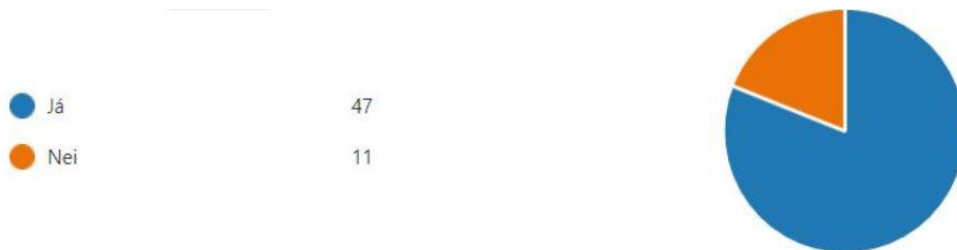
Mynd 10. Skoðaðir þú umsagnir frá kennum um nám nemandans, svokallaðar vörður sem gerðar eru reglulega yfir önnina og birtast á INNU?

stöðu sína í hverjum áfanga. Á Mynd 10 má sjá að mikill meirihluti svarenda skoðaði þessar umsagnir eða 81%. Í opinni spurningu sem fylgdi á eftir má sjá að þeir forsjáraðilar sem skoðaðu umsagnirnar eru afar ánægðir með þær. Þær gefi góða vísbendingu um hvernig nemandanum líður og séu nauðsynlegar til þess að fylgjast með framvindunni í náminu.