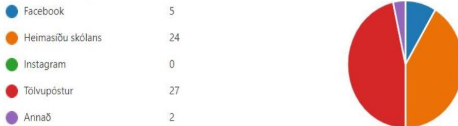
Mynd 5. Hvernig finnst þér best að nálgast upplýsingar um skólastarfið?

Þegar skoðað er hvar svarendum finnst best að nálgast upplýsingar um skólastarfið má sjá á Mynd 5 að tölvupóstur og heimasíða eru bestu leiðirnar. 47% svarenda nefna tölvupóst og 41% heimasíðu. Aðeins nefna 5 svarendur, eða 9%, að Facebook sé best til að nálgast upplýsingar um skólastarfið.