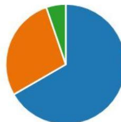
Mynd 9. Fylgist þú með heimanámi nemandans á kennsluvef skólans?

Nýlega breytti skólinn til og í staðinn fyrir miðannarmat svokallað voru settar inn þrjár vörður á hvorri önn sem nefnast ljósker, viti og varða. Á þessum vörðum fá nemendur umsagnir um