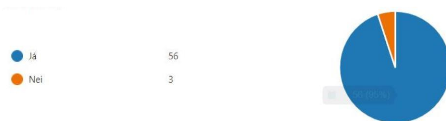
Mynd 1. Hefur þú heimsótt heimasíðu skólans?

Mynd 1 sýnir að langflestir svarendur hafa heimsótt heimasíðu skólans eða alls 56 af 59 svarendum eða 95%.